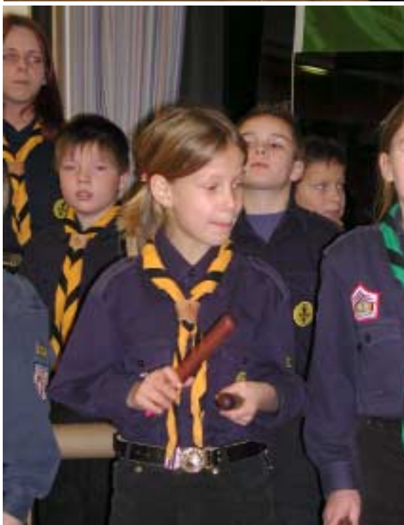
Meute Rotfuchs (Eckental) sang ihr Siegerlied vom Meutensingewettstreit des Landesverbandes Bayerns.